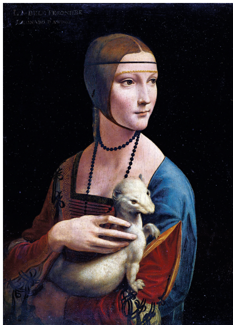
Leonardo da Vinci, 'De dame met de hermelijn', (1490)