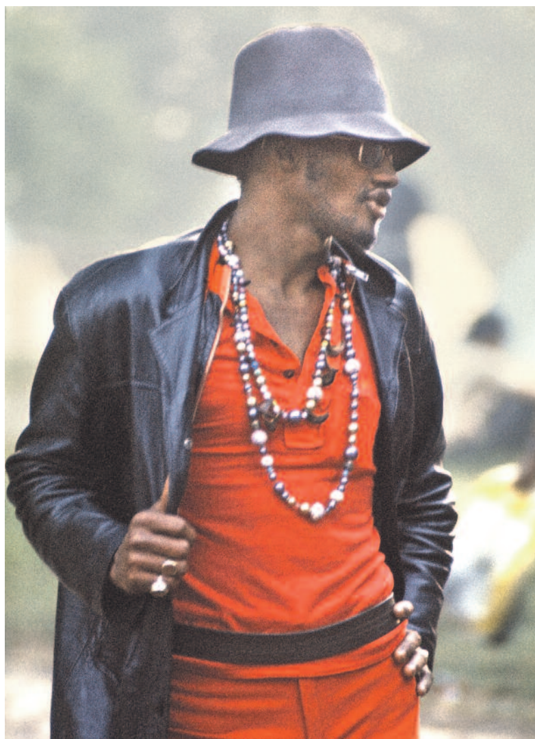
Foto links en rechts: Kralingengangers op het festivalterrein.